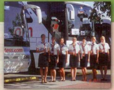
Студенты РМАТ на практике ориентированию

(одна из лучших в Европе высших школ по подготовке специалистов гостиничного менеджмента и туризма) является давним, стабильным и надежным партнером РМАТ.