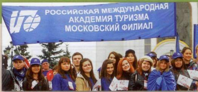
Студенты Московского филиала РМАТ на праздновании Дня московского студенчества