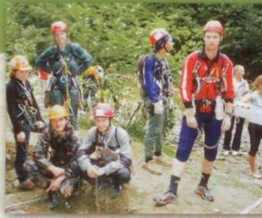
Соревнования по спортивному ориентированию