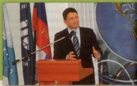
Генеральный секретарь Всемирной туристской организации ООН (UNWTO) Талеб Рифай выступает перед студентами РМАТ