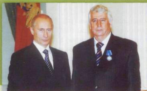
Президент Российской Федерации В.В. Путин в Кремле вручил Е.Н. Трофимову Орден Почета