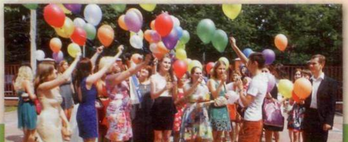
Выпускной бал в РМАТ