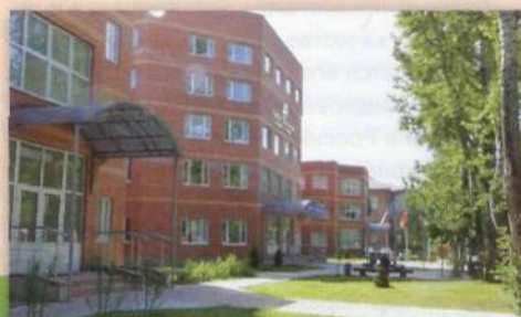
Учебные корпуса Российской международной академии туризма

В целях «подтягивания» туристской сферы России до высокого уровня мировых стандартов успешно осуществляется обучение по совместным программам с ведущими европейскими учебными заведениями и научно-исследовательскими центрами. На счету международной кафедры «Ватель-РМАТ» уже шесть выпусков бакалавров по совместной программе с получением двух дипломов – российского и французского. Французский Институт Ватель