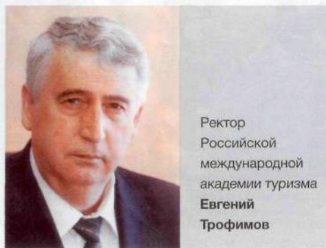
Ректор Российской международной академии туризма Евгений Трофимов

Обеспечить туристскую высококвалифицированными кадрами – задача вузов, готовящих специалистов туристского профиля и смежных сфер деятельности, к которым относится Российская международная академия туризма (РМАТ).