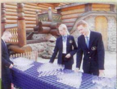
Студенты международной программы «Ватель-РМАТ» во время стажировки

Наши выпускники занимают высокие должности в сфере управления, являются топ-менеджерами в зарубежных и отечественных туркомпаниях, успешны в преподавательской и научной деятельности. В вузе постоянно повышаются требования к качеству обучения. По итогам проведенного Минобразования РФ мониторинга академия признана эффективным вузом, она аккредитована до 2020 года, а это значит, что у нее большое будущее.