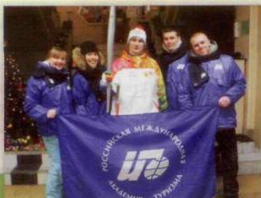
Участники эстафеты Олимпийского огня