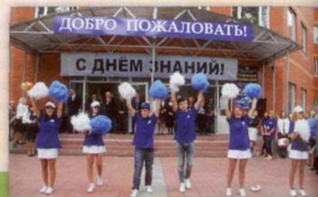
Празднование Дня знаний в РМАТ