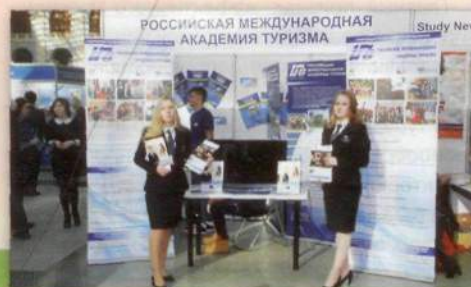
Стенд РМАТ на образовательной выставке